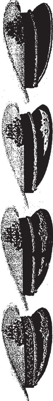
យូកកាស្ត្រូត

ឧបសម្ព័ន្ធក្នុងកិច្ចការសម្របសម្រួល ..... ចុះថ្ងៃទី ..... ខែ ..... ឆ្នាំ ២០០